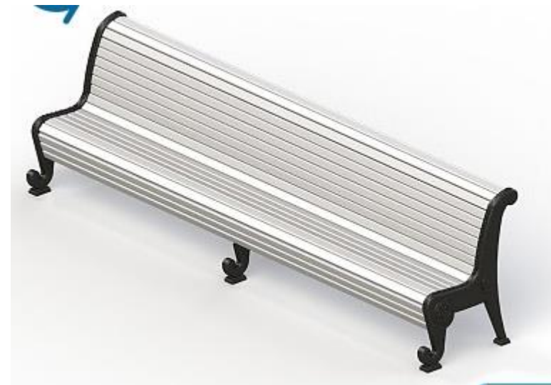
элемент 2 – лавочка парковая