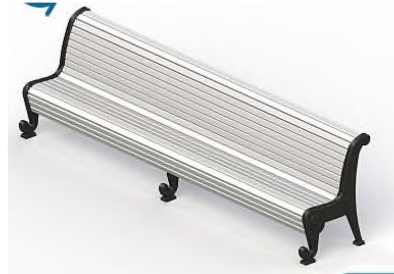
элемент 2 – лавочка парковая