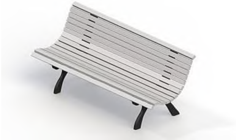
Элемент 1 – лавочка дворовая