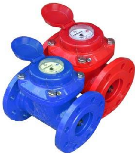
Рис. 4. Счетчики воды ВСКМ 90-50

Ультразвуковой расходомер US800 предназначен для измерения и учета текущего расхода и накопления объема жидкости (температурой до 200°C), протекающей под давлением в трубопроводе диаметром от 15 до 2000 мм на станции 1 и 2 подъема.