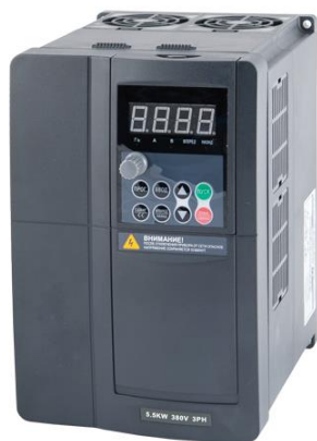
Рисунок 3. Внешний вид управляющего преобразователя.